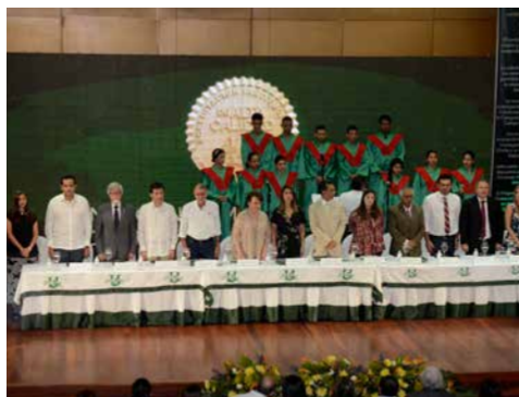
La instalación protocolaria del evento de entrega oficial de la Acreditación Institucional de Alta Calidad contó con la participación de la Coral Bolivariana, uno de los primeros grupos creados en Unisimón como parte de la oferta de la Dirección de Bienestar Universitario.