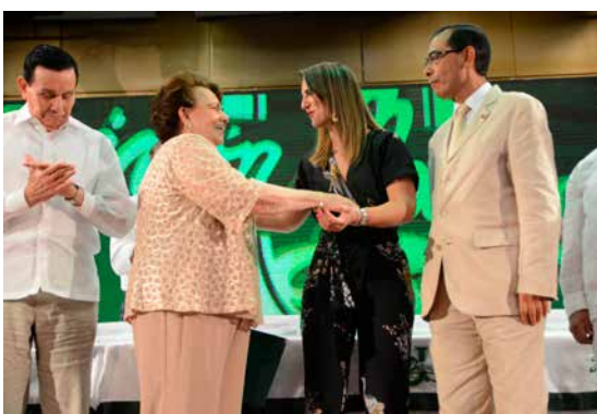
Durante la entrega de la Acreditación Institucional, la Ministra de Educación destacó que Unisimón pasó todos los filtros para obtener este reconocimiento y que su logro es una muestra palpable de que sí se puede hacer "la tarea" en el sector de la educación en Colombia.