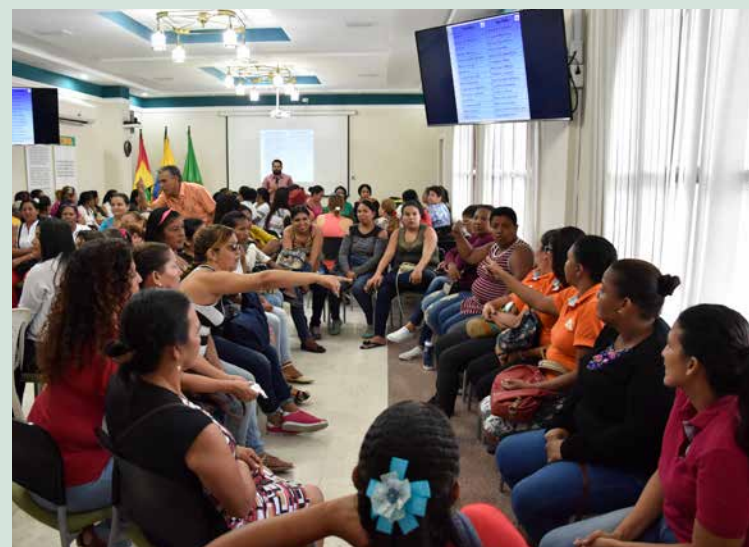
Durante su proceso de formación, las mujeres que hacen parte de este programa conocen las herramientas políticas, jurídicas y psicosociales para intervenir en los distintos espacios de construcción de ciudadanía.