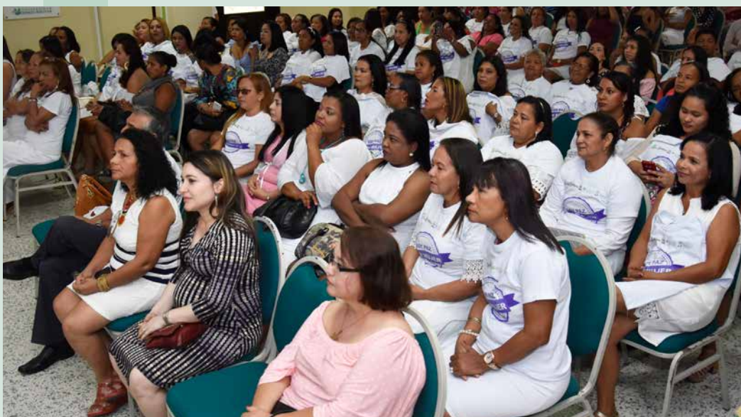
Mujeres formadas a través del programa liderado por la Alcaldía Distrital de Barranquilla y el Centro de Investigación e Innovación Social José Consuegra Higgins, de Unisimón.

En el marco del convenio interinstitucional entre el Programa Mujer y Equidad de Género, de la Secretaría de Gestión Social del Distrito, y la Universidad Simón Bolívar, se cumplió la graduación de 100 mujeres gestoras de paz y 300 mujeres emprendedoras, residenciadas en las cinco localidades del Distrito.