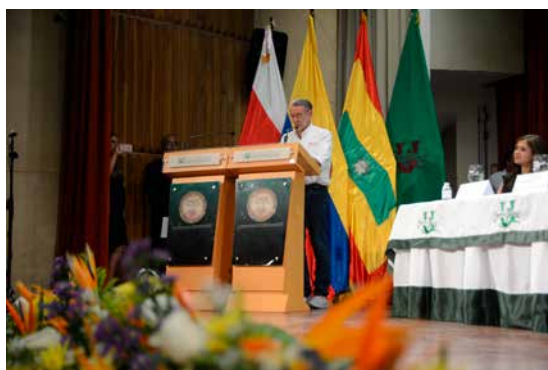
El Gobernador Eduardo Verano De la Rosa, destacó el compromiso de Unisimón con la educación superior de los jóvenes en los municipios del Atlántico.