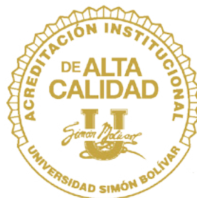
Res. 23095, del MEN