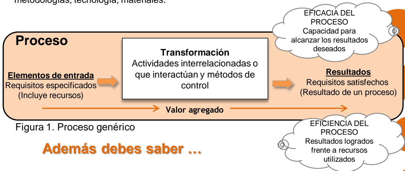
Figura 1. Proceso genérico

Conjunto de actividades interrelacionadas o que interactúan, las cuales transforman elementos de entrada en resultados, agregando valor en esa transformación. Estas actividades requieren la asignación de variedad de recursos en personas, equipos, metodologías, tecnología, materiales.