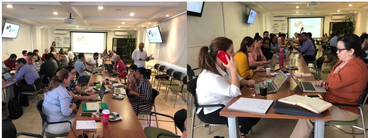
Mesas de trabajo – Taller Formulación Plan de Mejoramiento Institucional

El Plan de Mejoramiento Institucional (PMI) se construyó a partir de la identificación y análisis de las fortalezas y debilidades asociadas a cada uno de los factores del modelo de acreditación del CNA consignadas en el informe de autoevaluación con fines de la renovación de la acreditación institucional, tomando como referente la incidencia de estos en el cumplimiento de la misión y los objetivos institucionales; consecuentemente, se procedió con la definición de acciones de mejoramiento para el abordaje de debilidades y oportunidades de mejoramiento, y acciones de sostenimiento orientadas a mantener y consolidar las fortalezas, que en su conjunto integran el plan.