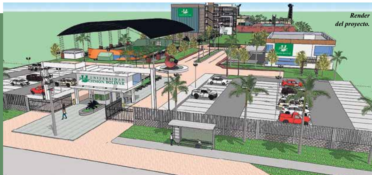
Render del proyecto.

“Puerto Colombia es uno de los municipios más educados del país, ya que cuenta en su jurisdicción, con el mayor número de instituciones de educación superior” manifestó Consuegra Bolívar al destacar que es el principal motivo para anclar esta nueva sede allí.