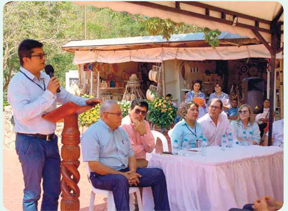
Aspecto del evento de firma del convenio.

Dentro de los compromisos adquiridos, la Universidad Simón Bolívar, a través del CIISO y MacondoLab, desarrollará un proceso de planeación territorial con enfoque participativo, que permita consolidar a Usiacurí en la certificación turística que requiere el proyecto.