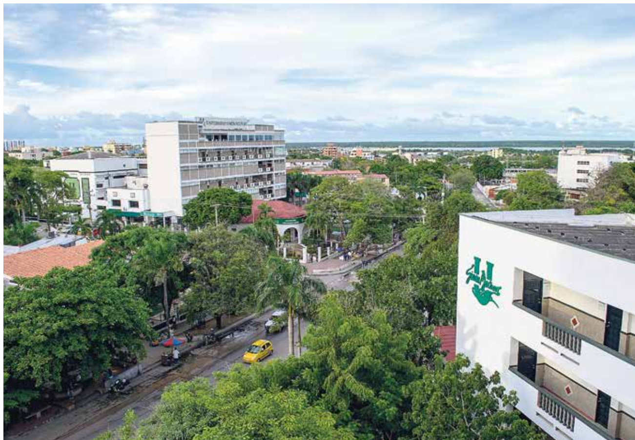
El ranking THE evalúa si las instituciones cumplen con los Objetivos de Desarrollo Sostenible (ODS) de Naciones Unidas. Unisimón es la mejor en Igualdad de Género.

La Universidad Simón Bolívar es una de las ocho instituciones de educación superior colombianas con mayor impacto social en el mundo, entre las más de 450 incluidas en el último ranking de la firma británica Times Higher Education (THE).