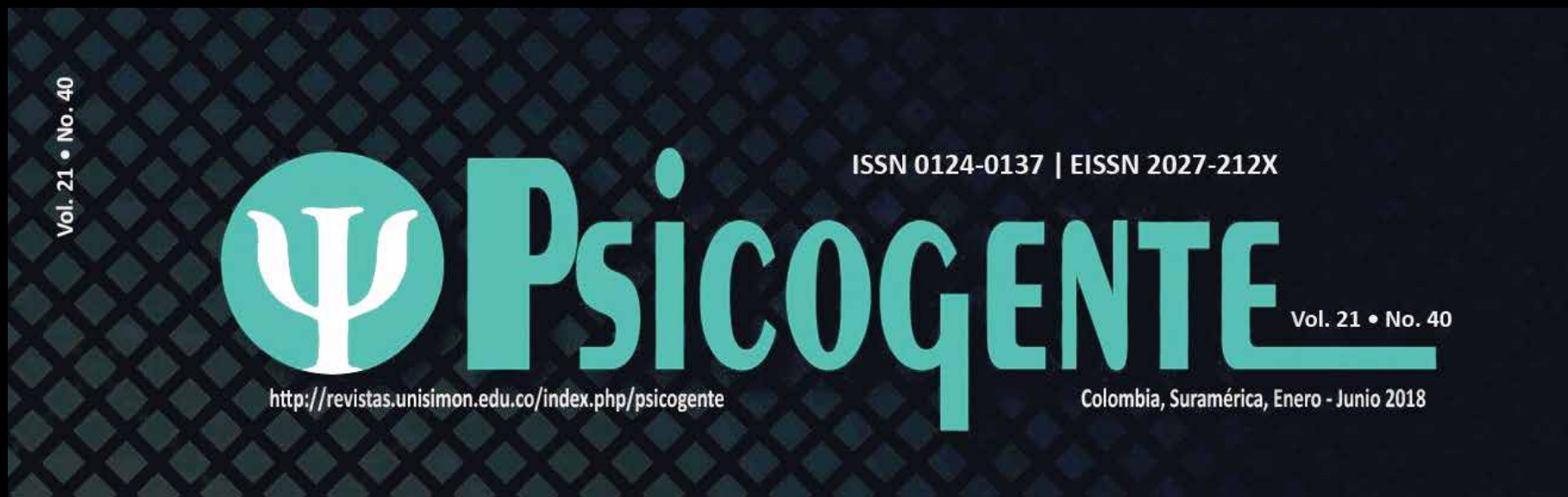
Imagen oficial de la revista Psicogente.