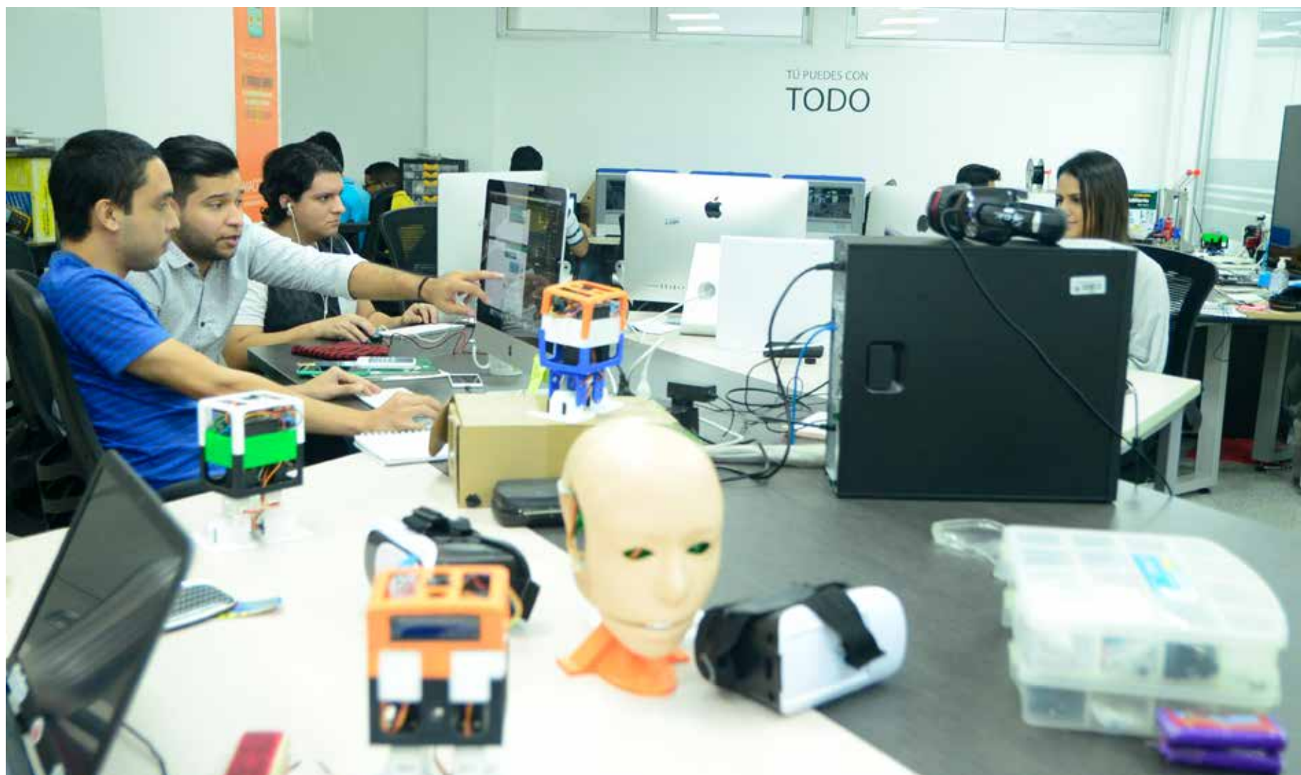
Laboratorio de prototipado del centro de crecimiento empresarial Macondolab.

La Universidad Simón Bolívar se mantuvo a la cabeza del ranking DTI-Sapiens, entre 212 instituciones de educación superior (IES) privadas y públicas del país cuyos indicadores de desarrollo tecnológico e innovación fueron evaluados por la firma Sapiens Research.