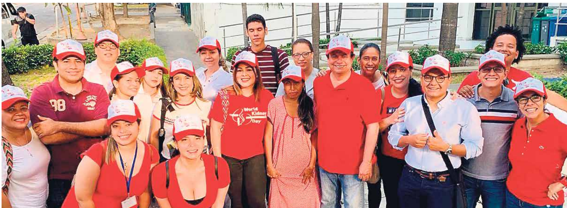
La actividad se realizó en marzo, en 23 territorios del país entre ciudades y municipios, a propósito del Día Mundial del Riñón.

La Universidad Simón Bolívar hizo parte de la brigada de salud renal que benefició a más de 5.000 miembros de 19 comunidades indígenas en Colombia. Esta jornada se realizó como parte de las actividades de conmemoración del Día Mundial del Riñón propuestas por la Organización Mundial de la Salud (OMS).