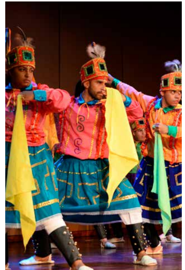
Grupo de Danzas de la Universidad la Gran Colombia