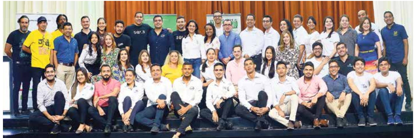
Grupo de participantes en la última versión de Quilla Innova junto a los mentores de la Unidad de Apoyo al Empresario.