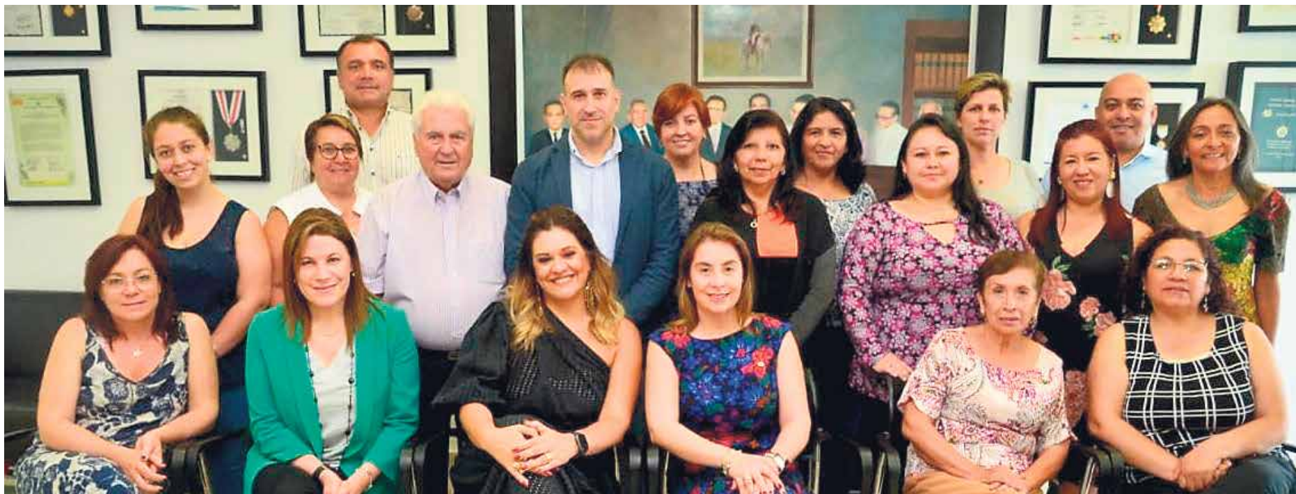
Asistentes a las reuniones de la Asamblea Consultiva de la Confederación Mundial de Fisioterapia- Región Suramérica- (WCPT-SAR) llevadas a cabo en Unisimón.

Durante una semana la ciudad de Barranquilla fue la sede de diferentes jornadas académicas relacionadas con la actividad de la Fisioterapia a nivel latinoamericano. La Universidad Simón Bolívar se convirtió en el escenario de las reuniones de la Asamblea Consultiva de la Confederación Mundial de Fisioterapia- Región Suramérica- (WCPT-SAR), de la Confederación Latinoamericana de Fisioterapia y Kinesiología (CLAFK) y del Centro Latinoamericano para el desarrollo de la Fisioterapia y la Kinesiología (CLADEFK).