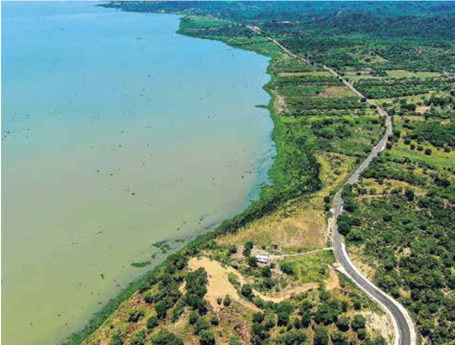
Foto aérea de la zona del embalse del Guájaro.