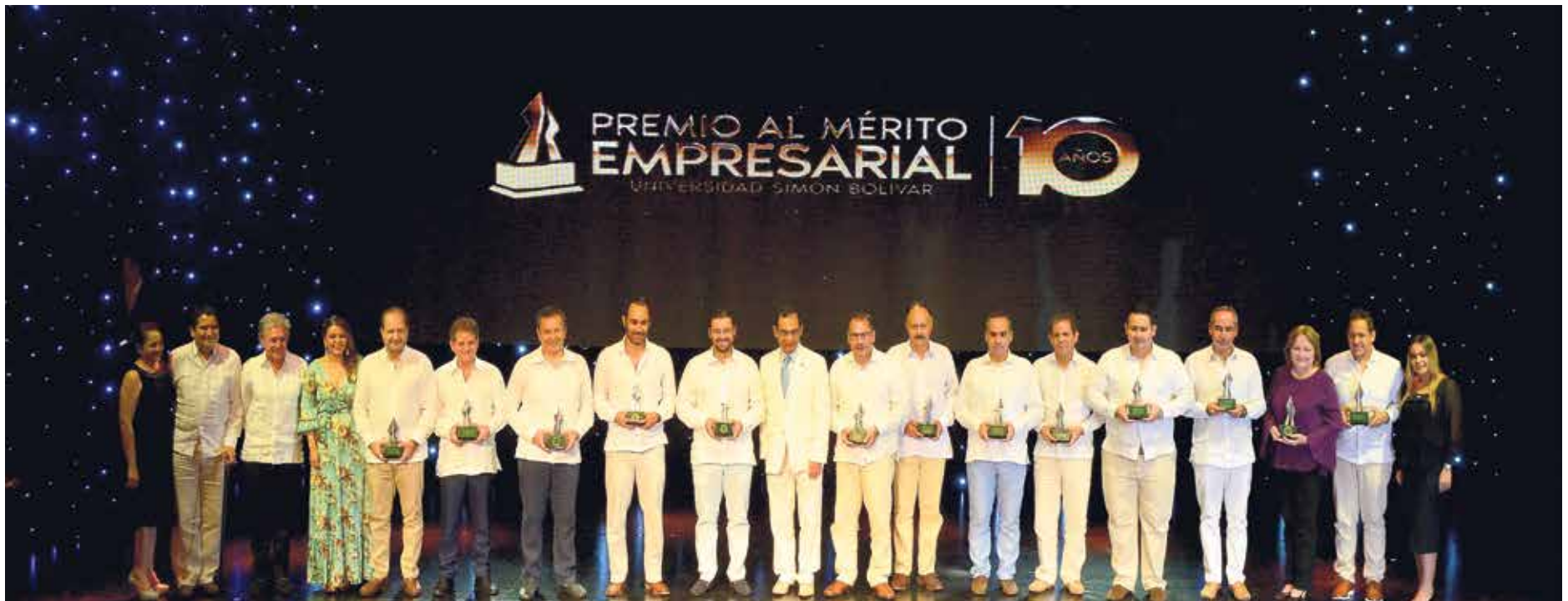
Ganadores de la décima edición del Premio al Mérito Empresarial Universidad Simón Bolívar.

En el Teatro José Consuegra Higgins de la Universidad Simón Bolívar se entregaron dieciocho (18) estatuillas del Premio al Mérito en su décima versión, con transmisión en directo por el Canal Regional Telecaribe y otros medios digitales.