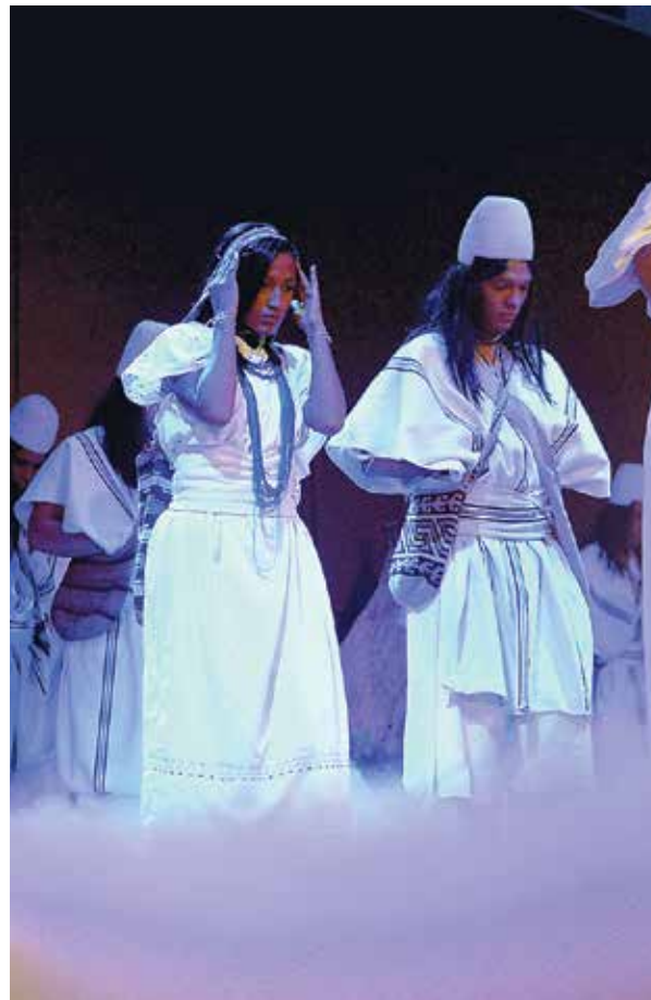
Grupo de Danzas de la Universidad del Magdalena.