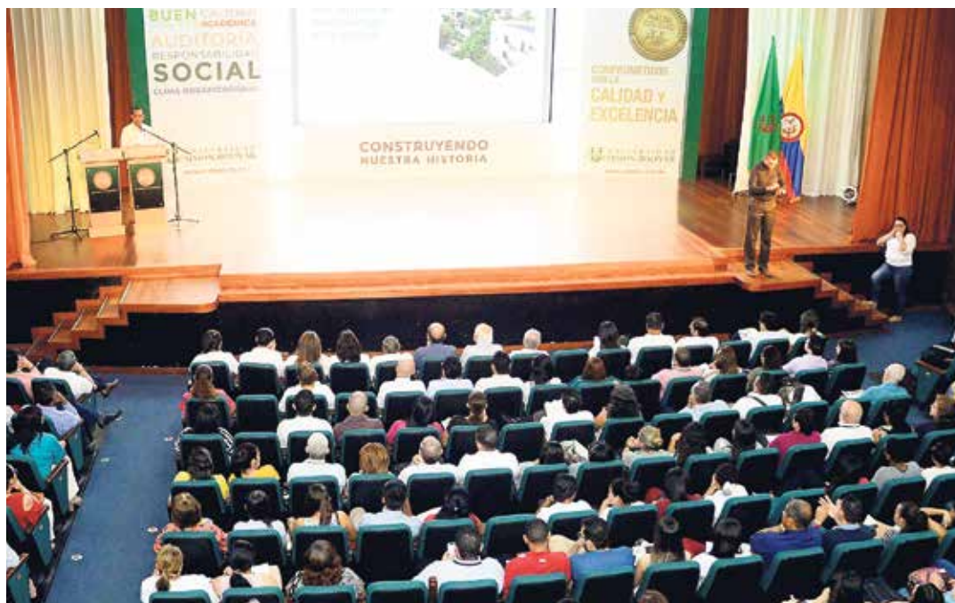
Aspecto general de la jornada de rendición de cuentas de Unisimón.