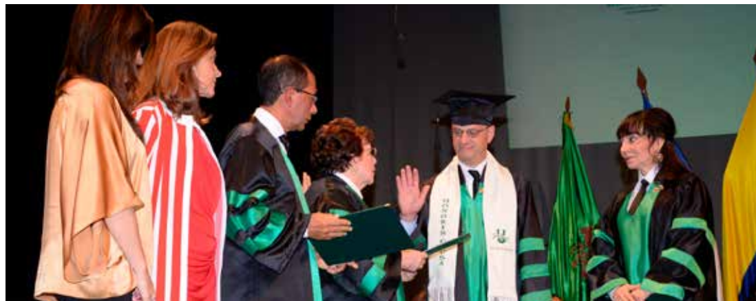
Jean-Michel Blanquer durante la toma de juramento, junto a las directivas universitarias y a la vicepresidenta de la república, Martha Lucía Ramírez, y la ministra de educación nacional, María Victoria Angulo