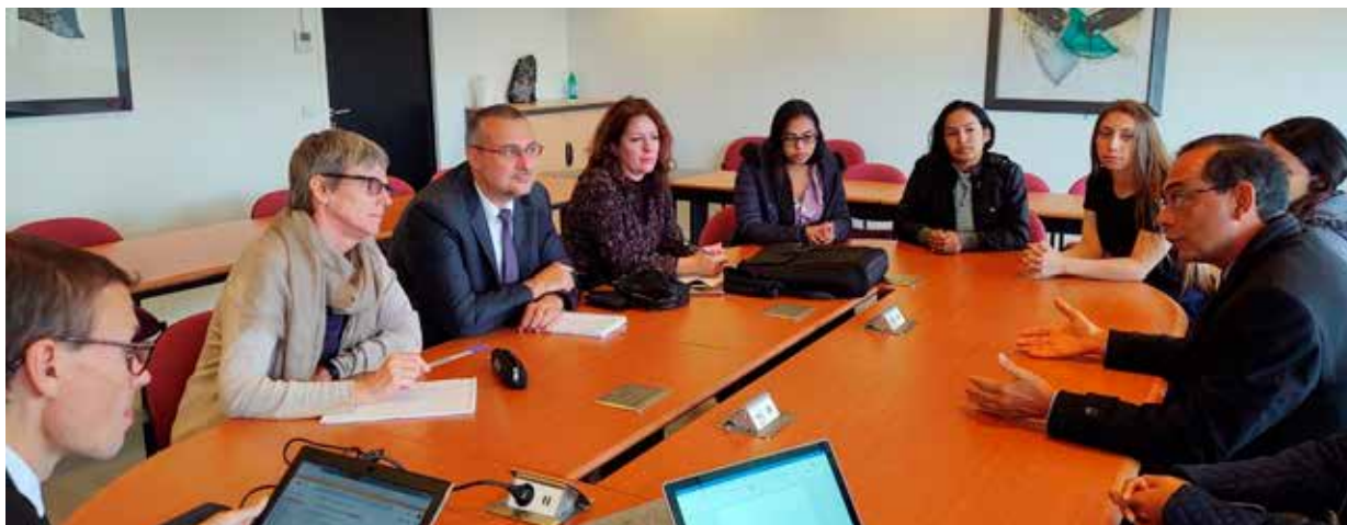
El rector de Unisimón junto a estudiantes de intercambio en la Université Paris-EstCréteil.

Durante el encuentro, los asistentes actualizaron el convenio de doble titulación de los programas de Administración de Empresas y Comercio y Negocios Internacionales entre las dos instituciones y analizaron alternativas para la colaboración en las áreas de logística portuaria, ingeniería civil y ciencias de la salud.