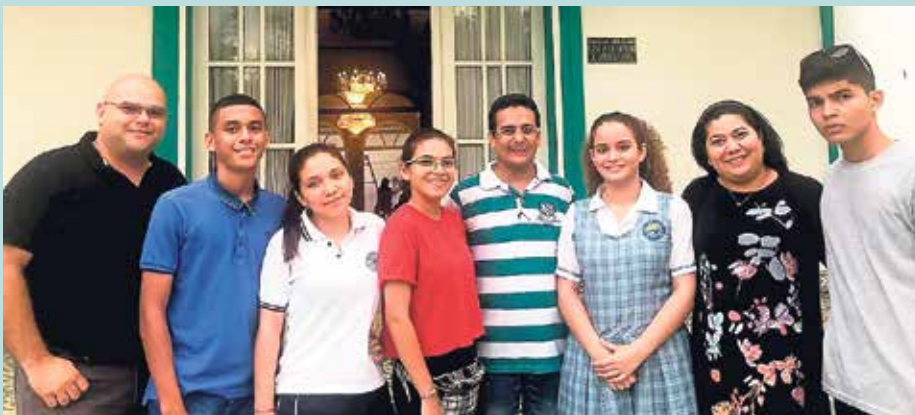
Los estudiantes seleccionados, junto a sus profesores y líderes del programa Ondas Atlántico.

Luego de un proceso de evaluación y verificación de requisitos por parte del Ministerio de Educación Nacional, Icetex y Colciencias, así como la selección a cargo de la Comisión Nacional de Becas, 5 estudiantes pertenecientes a Ondas Atlántico, que coordina la Universidad Simón Bolívar, fueron seleccionados para participar en el programa Sakura Science 2019 que se llevó a cabo en Japón en noviembre pasado.