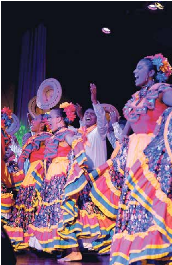
Grupo de Danzas de la Universidad del Atlántico.