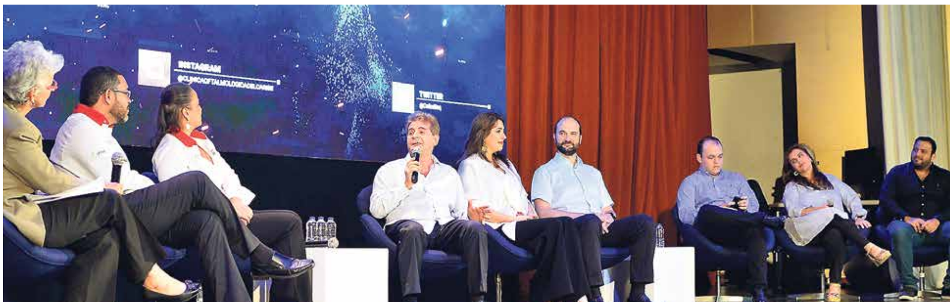
La presentación de SAHLI se realizó en el Teatro José Consuegra Higgins de la Universidad Simón Bolívar.

Un robot creado en Colombia otorgará a pacientes con problemas oculares lo que más necesitan para el tratamiento de su enfermedad o para conservar la vista: SAHLI, que resume Sistema Autónomo de Habilidades de Lectura Independiente, es capaz de diagnosticar cuatro tipos de trastornos en la retina humana en un lapso de 10 a 20 segundos, con 99% de confiabilidad.