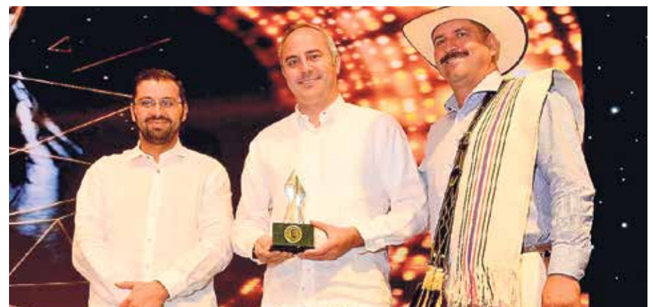
Representantes de la Federación Nacional de Cafeteros recibiendo el premio en la categoría Empresa Perseverante.