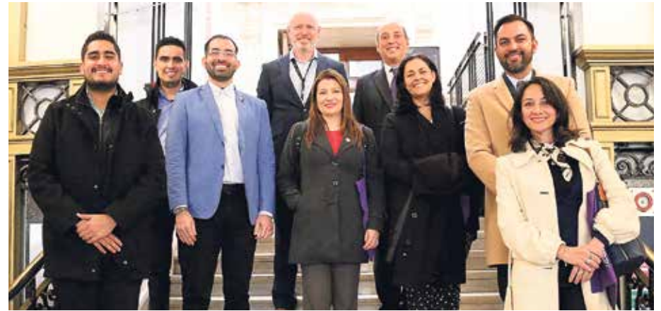
Miembros de la misión académica de Unisimón junto a directivos de Universidad en Inglaterra.

Para las directivas de la Universidad Simón Bolívar la educación superior del mundo enfrenta grandes incertidumbres y cambios que obligan a estas instituciones a modernizarse y anticiparse a los nuevos retos de la sociedad, de manera que se garantice su sostenibilidad a largo plazo y su liderazgo social.