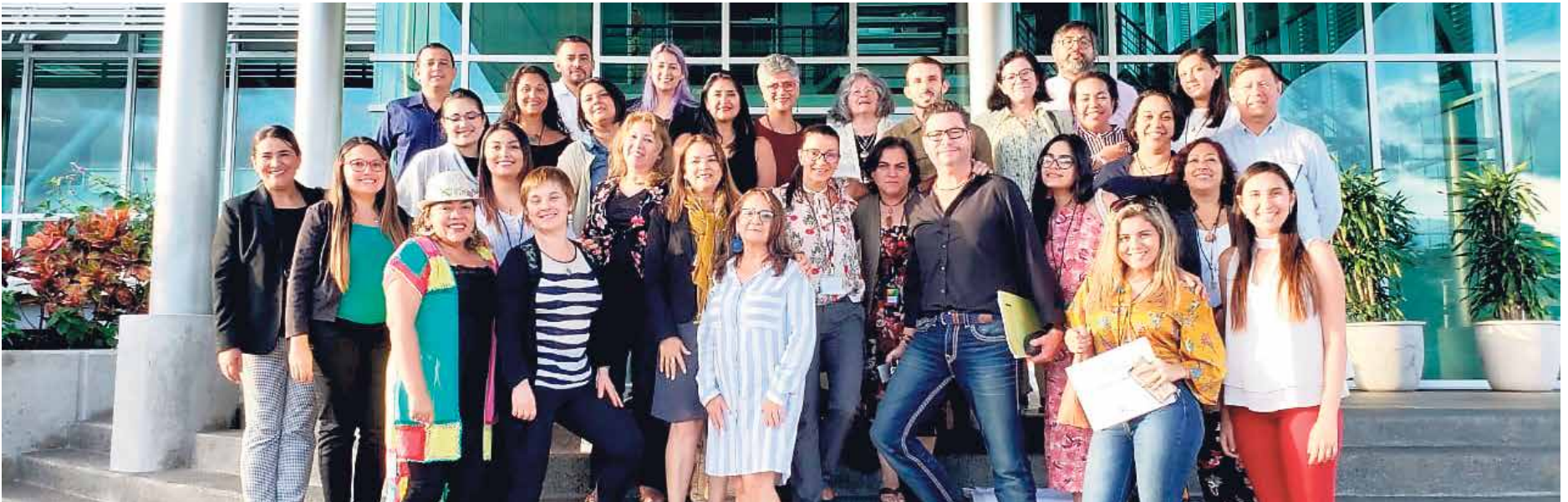
Asistentes al encuentro de la Red Iberoamericana de Estudios Interculturales e Interdisciplinarios.