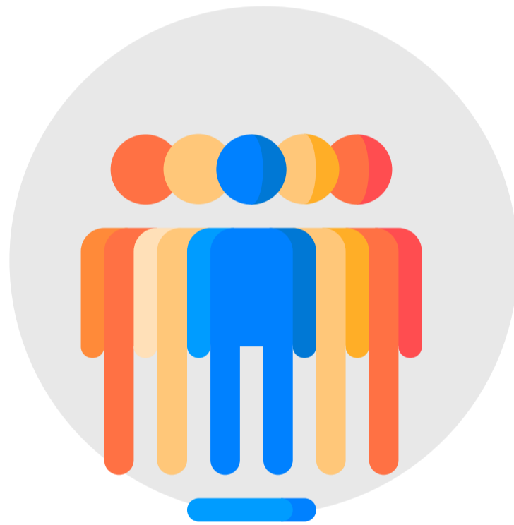
Líderes Aula Extendida y Coordinadores de Formación