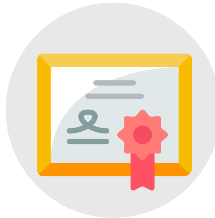
Programación de Cualificación de profesores